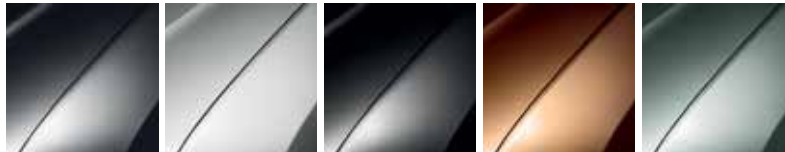
GRİ FÜME (KNA)